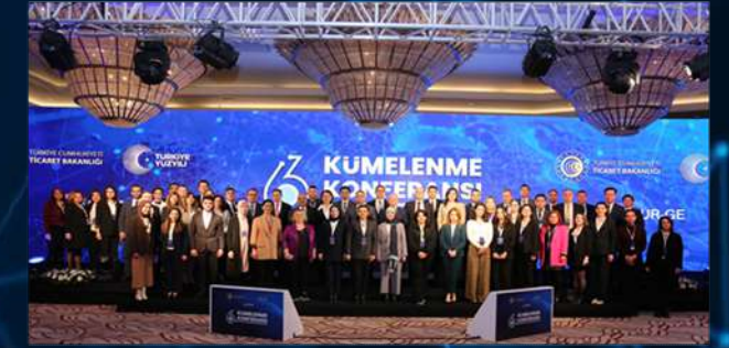
Şubat 2024, Ankara 6. Kümelenme Konferansı