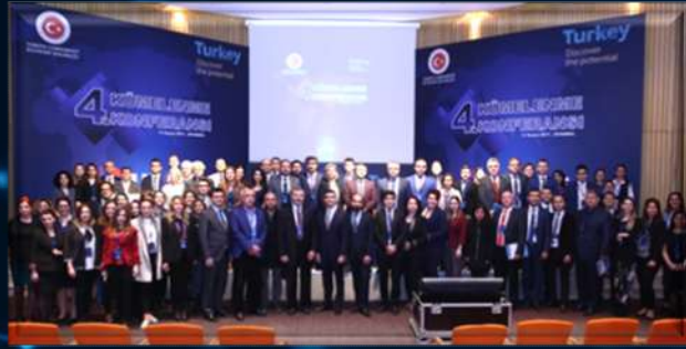
Kasım 2017, İstanbul 4. Kümelenme Konferansı