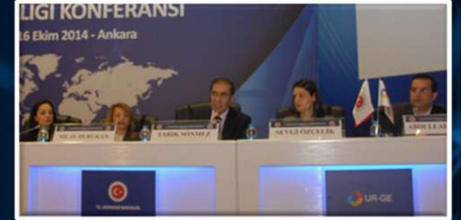
Ekim 2014, Ankara 3. Kümelenme Konferansı