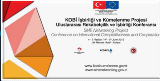
Haziran 2013, Ankara 1. Kümelenme Konferansı